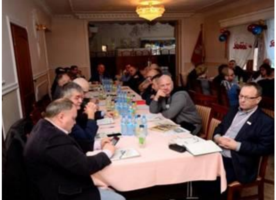
Delegaci Krajowej Sekcji na Zebraniu