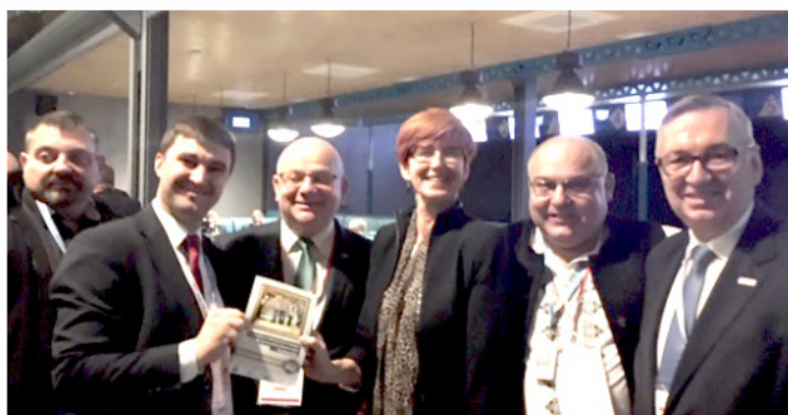
Na Zjeździe Solidarności z Elżbietą Rafalską i Stanisławem Szwedem, Sekretarzem Stanu w MRPiPS (pierwszy od prawej).

Osobiste poparcie dla programu wyraziła Elżbieta Rafalska , Minister Rodziny, Pracy i Polityki Społecznej.